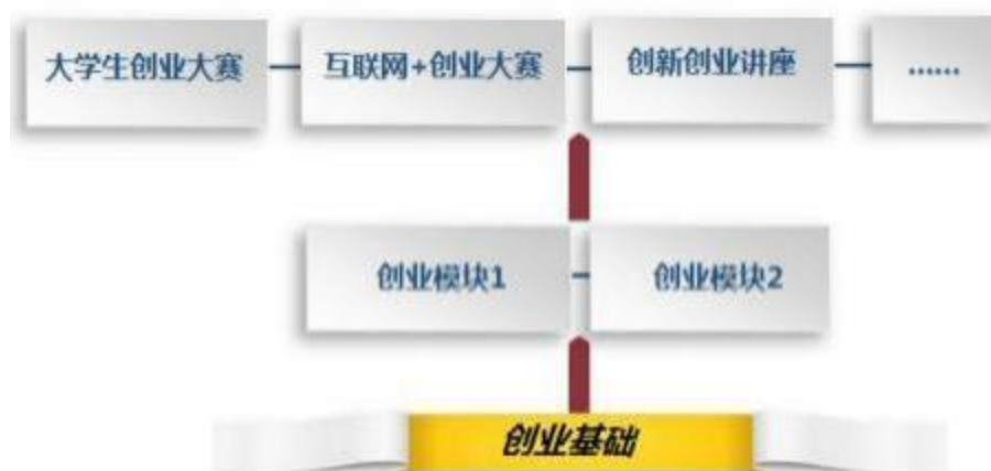
图3创新创业课程体系建设思路

创新创业教育实践课程模块的培养目标是了解创业的流程、企业的运营模式和项目运作等，掌握创业的基本技能，培养学生分析问题和解决问题的能力，提升学生的个人综合能力。可通过鼓励和组织学生参加企业经营管理类培训、大学生创业大赛、互联网+大赛、大学生创新创业项目等培训或比赛，邀请企业、行业专家开展专题训练，指导学生创新创业活动，促进创新创业的实践教学。其次，可以按照创业活动项目和特定的活动方式，开发创业沙盘、教学游戏和教学案例库，通过现实或模拟的创业实践活动，利用与专业相关的实践平台，利用虚拟的训练或虚拟创业公司，让学生身临其境地感触和体验创业的全部业务流程。创新创业实践课模块安排在第3-5学期，让学生在结合所学的专业基础上来领悟创新创业知识，提高创新创业能力。